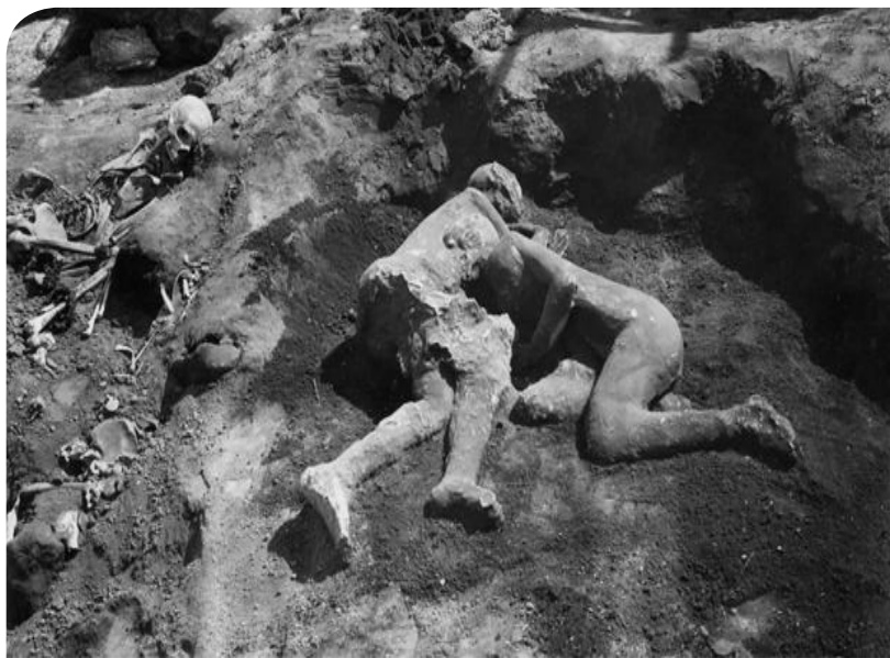
• ABC, 2017, El abrazo de Pompeya, ilustración. Recuperado de: www.abc.es/cultura/abci-abrazo-pompeya-realidad-hombres-201704080128_noticia.html

La consagración carnal entre similares, en el efímero envolverse entre brazos, supera la fugacidad circunstancial de la esencia: encapsula la eternidad en un perpetuo instante.