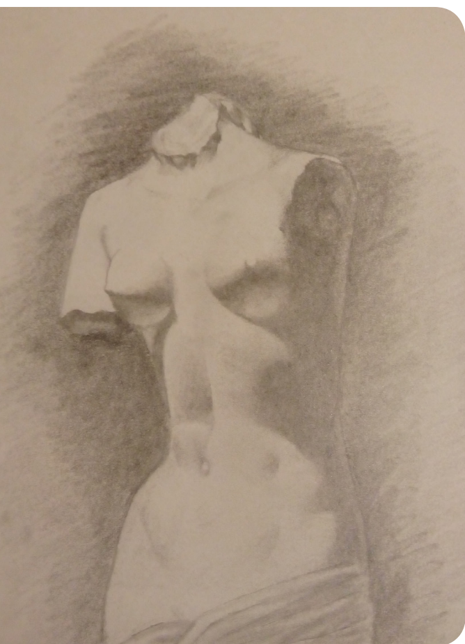
Sombras Uriel Sebastián Leal Sánchez (Humanidades) Lápiz sobre papel 15 x 20 cm 2017

I Sin espacio intermedio, sólo el desnudo. Sin extensión del hombre al espejo, sólo el género.