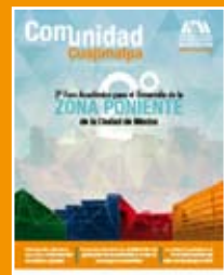
Ilustración: Carlos R. Flores Sevilla

Portada Núm. 20 2º Foro Académico para el Desarrollo de la Zona Poniente de la Ciudad de México