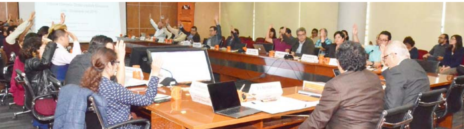
▲ Sesión CUA-133-17 del Consejo Académico de la Unidad Cuajimalpa

El Rector de la Unidad Cuajimalpa dijo que los resultados obtenidos constatan que el compromiso y esfuerzo conjunto de los alumnos, el personal académico y los trabajadores administrativos hicieron posible avanzar en la consolidación y posicionamiento de esta sede académica como una de las mejores opciones de educación superior a nivel nacional e internacional y, particularmente, en la zona poniente de la Ciudad de México. ▀