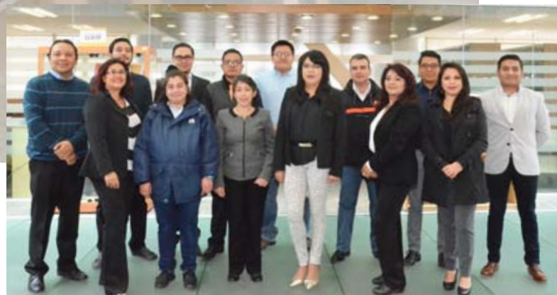
► Miembros de la Coordinación de Servicios Bibliotecarios

Uno de los retos planteados en el Plan de Desarrollo Institucional 2012-2024 de la Unidad Cuajimalpa (PDI), fue someter a certificación de calidad los procedimientos que se siguen para ofrecer los servicios que se brindan en las diferentes coordinaciones administrativas de la Unidad. El pasado 4 de abril, la Biblioteca Dr. Miguel León-Portilla, obtuvo la primera certificación bajo la Norma ISO 9001:2015, emitida por EQA, Certificación México, S.A. de C.V.