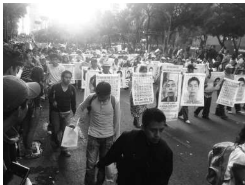
Imágenes 4, 5 y 6.

Los rostros de los normalistas fueron visibilizados por los manifestantes.