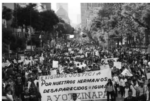
Imagen 1. Marcha 8 de octubre 2014.

Es importante destacar que la juventud rural en sí no ha sido un tema en las protestas del 2014; el rostro visible de ésta ha sido los estudiantes normalistas, un problema que se desarrolló al nivel de la educación en general, pero también los jóvenes que viajaban a las ciudades para participar en las marchas. La emoción general que gobernó la manifestación fue la de rabia y enojo. Y la identidad que prevaleció fue la de “estudiante”: