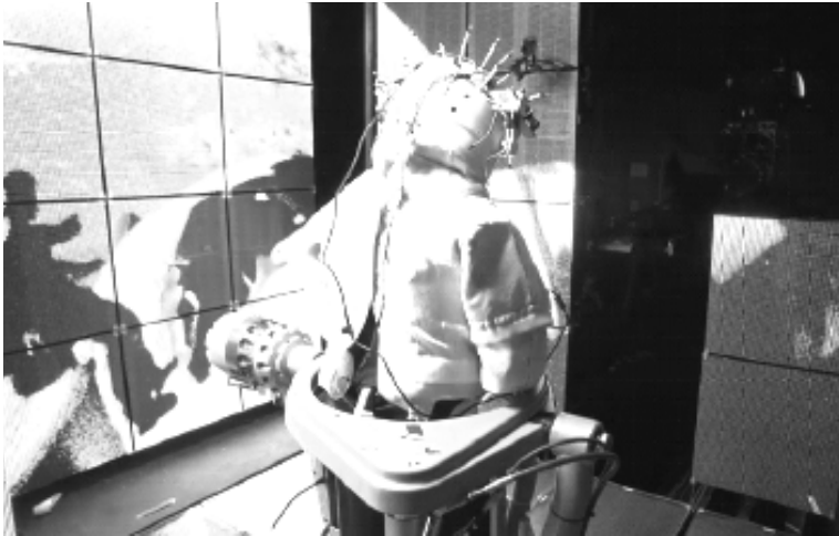
Imagen 1. La caja de luz empleada en el rodaje de Gravity .

La caja de luz es una pantalla LED en forma de cubo, en cuyo interior los actores desarrollaron la mayoría de las escenas del filme; este dispositivo permite la construcción de un entorno realista e inmersivo, congruente con la decisión de Cuarón de que Gravity se realizara para proyectarse en 3D. La ventaja de este monitor tridimensional es que, además de construir el espacio en que se lleva a cabo la narración del filme (gracias a la presencia de la tierra, la luna, el sol, las estaciones espaciales y los personajes), sirve como fuente de las referencias visuales para la orientación de los actores, mientras cumple con la función de iluminarlos. De este modo, la temperatura de luz y color, los reflejos en las escafandras y los ojos de los personajes, así como el movimiento de las imágenes en la pantalla LED (que dan la impresión del movimiento ingrávido de los personajes en un entorno continuo), generan una visualidad compleja y congruente, que permite su interpretación como una globalidad verosímil.