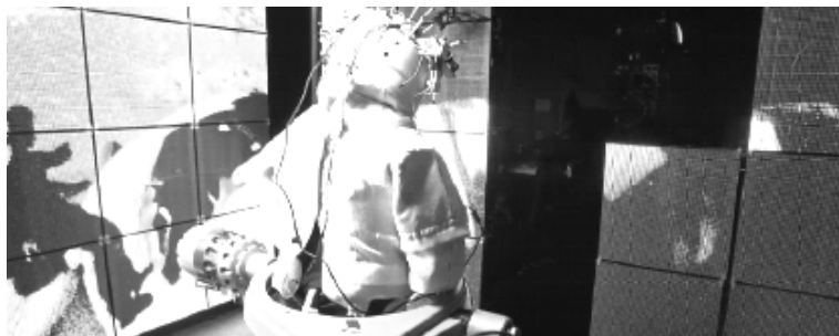
Image 1. The Light Box used in the filming of Gravity .

The Light Box is a LED screen in the shape of a cube in whose inside actors execute most of the scenes in the film; this mechanism allows the construction of a realistic and immersive environment, consistent with Cuarón's decision that Gravity be produced as a 3D film. The advantage of this tridimensional screen is that, apart from constructing the space in which the story of the film takes place (thanks to the presence of the Earth, the Moon, the Sun, the space stations, and the characters), it shows the visual cues that the actors need for orientation, while also fulfilling the purpose of illuminating them. In this way, the light and color temperature, the reflections on the space suits and the eyes of the characters, as well as the movement of the images on the LED screen (which give the impression of the characters' weightless movements in a continuous environment), produce a complex and congruent visuality that allows for its interpretation as a verisimilar totality.