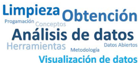
Figura 2 Principales necesidades de los periodistas de investigación.

para conocer qué tanto sabían sobre Periodismo de Datos, qué tantas partes de la metodología conocían o habían aplicado en su trabajo y, finalmente, los principales problemas que enfrentaron al intentar aplicarla. Además, se les consultó sobre las fases de la metodología que les presentaban mayor complicación. La figura 2 muestra los términos más utilizados al contestar la encuesta haciendo énfasis en las principales barreras: cada una de las fases de la metodología del Periodismo de Datos.