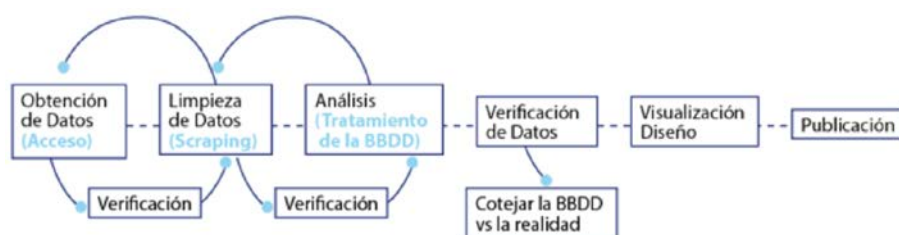
Figura 1 Metodología del Periodismo de Datos (Creación Propia).

Periodismo de Datos requiere de habilidades precisas. Por ejemplo, los periodistas deben buscar los datos y limpiarlos, aunque lamentablemente las bases de datos que proporciona el gobierno o que se encuentran en la red, están ‘sucias’ es decir, contienen espacios innecesarios, letras o símbolos que se repiten y esto hace que el análisis de los datos no sea óptimo. Para ello, es necesario realizar una adecuada limpieza de las bases de datos para poder avanzar al siguiente paso que es el análisis. En esta fase se pueden encontrar patrones que no se habían considerado antes y que pueden darle un giro a la investigación. Otra de las etapas del Periodismo de Datos es la visualización la cual es la presentación de todos los pasos anteriores, enfocándose en dotar a los lectores de la información pertinente y que puedan identificar claramente los puntos claves del proyecto, así como que lo entregado tenga un impacto relevante en la sociedad. Es así como el periodista tradicional se enfrenta a una serie de tareas para las que no estaba habilitado y que incluyen las etapas presentadas en la figura 1.