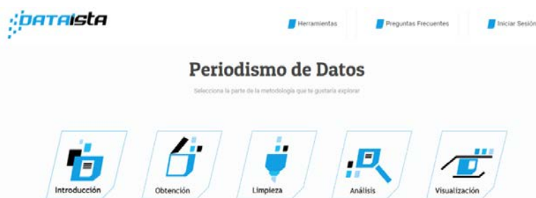
Figura 3 Vista del menú principal del sistema.

Mediante el uso de videos infográficos, el usuario puede identificar la forma en la que todas las etapas de la metodología están conectadas, figura 4. Algunos temas, contienen infografías con el paso a paso sobre cómo realizar cierta actividad, por ejemplo, el scraping . Además, cada parte de la metodología cuenta con su propia herramienta auxiliar, misma que servirá al usuario para practicar los conocimientos y habilidades adquiridos dentro del sistema. Asimismo, el usuario es capaz de regresar a cualquiera de las etapas que conforman la metodología, así como saltar las que considera que ya domina. Esto le permite al usuario ubicarse dentro del proceso.